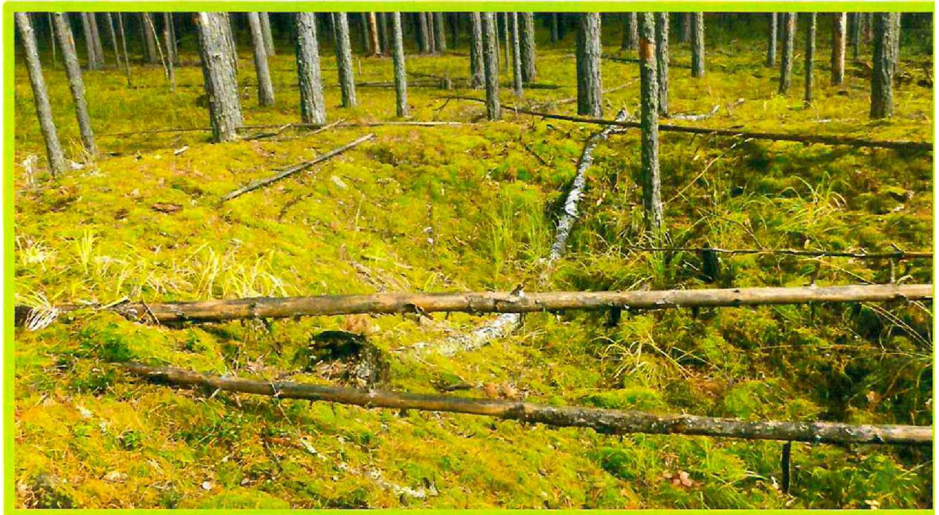
Изображение № 1 Валежник

К собственным нуждам граждан относятся потребности граждан и членов их семей в лесных ресурсах, предусматривающие конечное использования лесных ресурсов внутри семьи Примеры валежника (смотри изображения ММ 1,2,3).