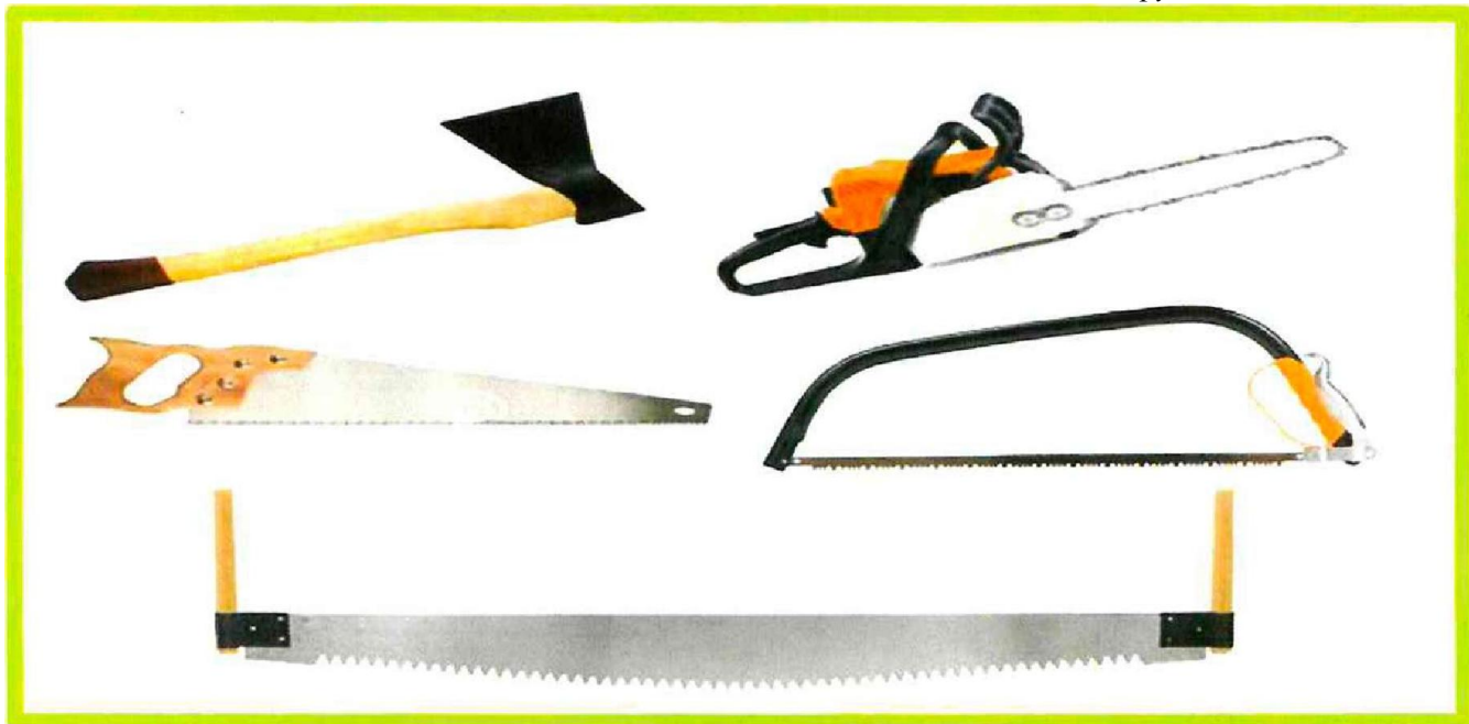
Изображение № 8 Разрешенные инструменты для заготовки

При заготовке валежника допускается применение ручного инструмента (ручных пил, топоров, бензопил) ( смотри изображение 8 ).