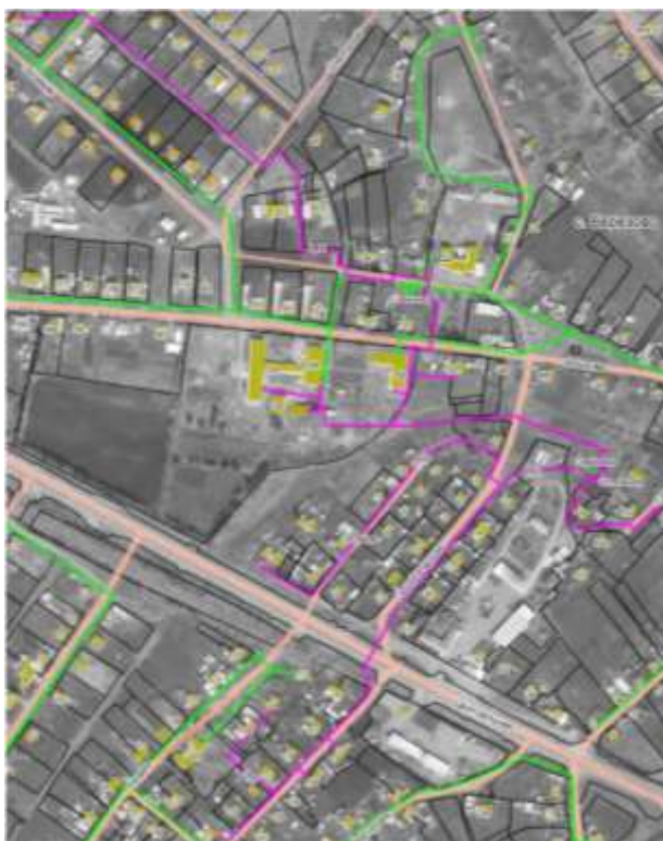
Рис. 4. Существующая зона действия котельной с. Березово