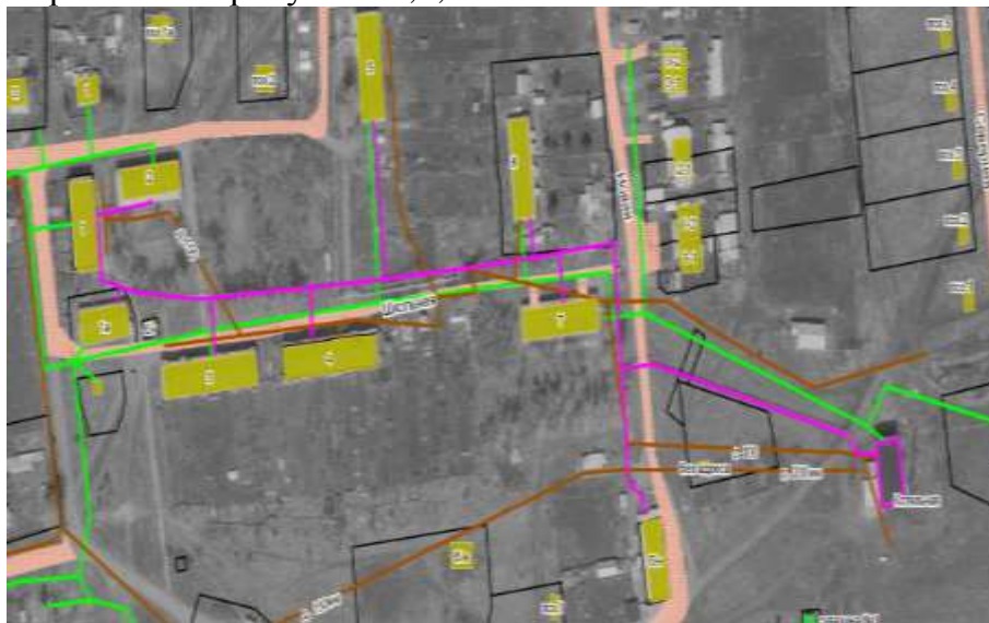
Рис. 2. Существующая зона действия котельной д. Сухая речка

Границы существующей зоны действия котельных Березовского сельского поселения изображены на рисунках 2,3,4.