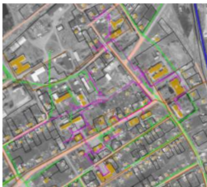
Рис. 3. Существующая зона действия котельной п. Новостройка