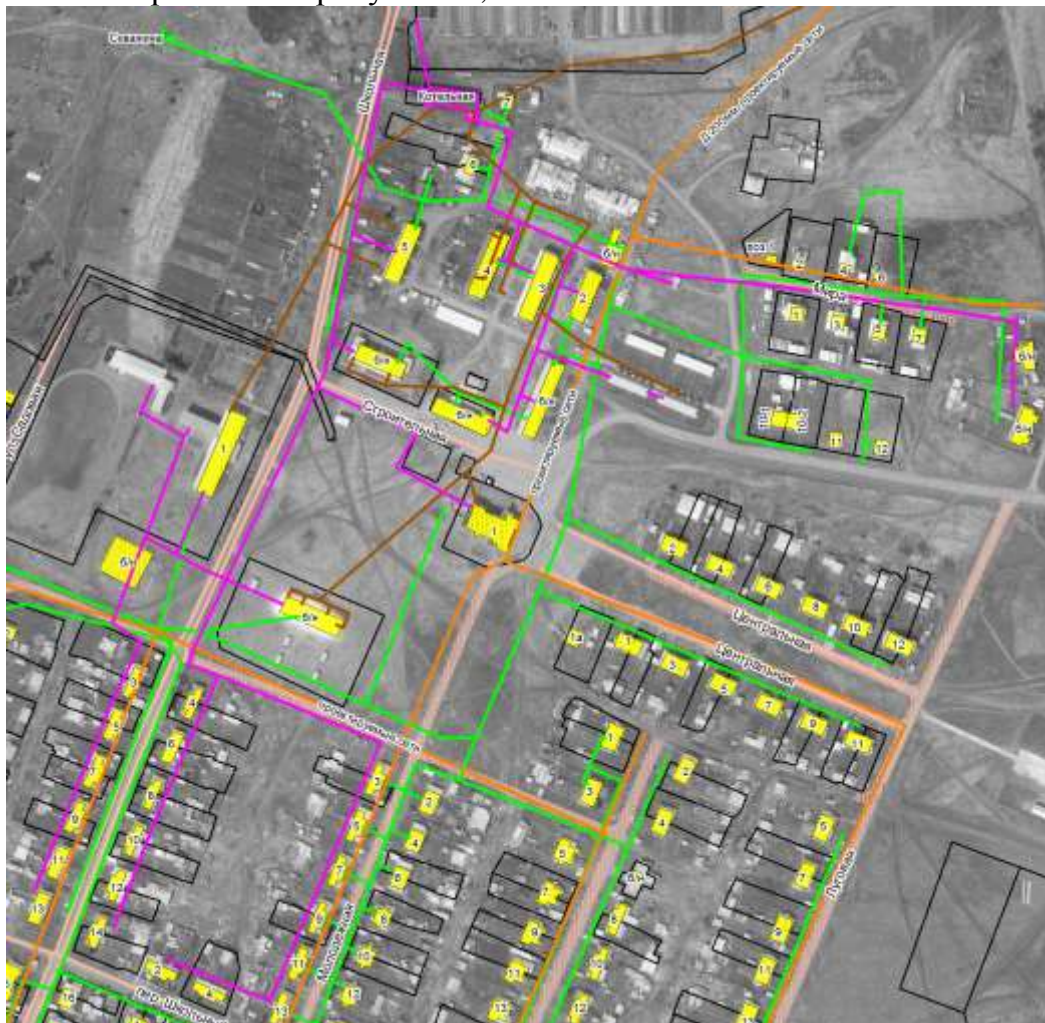
Рис. 2. Существующая зона действия котельной д. Береговая

Границы существующей зоны действия котельных Берегового сельского поселения изображены на рисунках 2, 3.