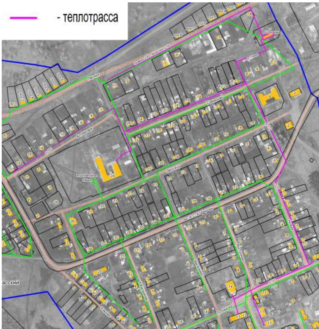
Рис. 3. Существующая зона действия котельной п. Кузбасский